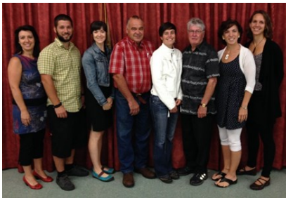
Les membres du comité organisateur en compagnie des conférencières et des représentants de la Municipalité de Kamouraska.